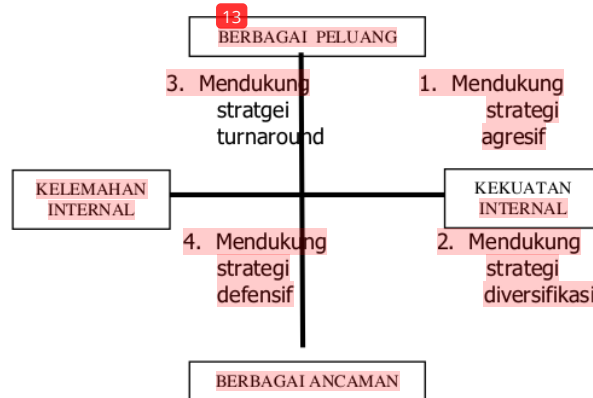
Gambar 1. Diagram Analisis SWOT

Data-data yang diperoleh dari hasil penelitian akan dianalisis kekuatan, kelemahan, peluang dan ancamannya sebagai dasar untuk merencanakan strategi pemasaran oleh usaha Raja Meubel Bengkulu dalam mengembangkan usahanya. Sedangkan untuk menentukan formulasi strategi pemasaran yang akan datang dilakukan penggabungan dari formulasi alternatif strategi pemasaran melalui matrik SWOT.