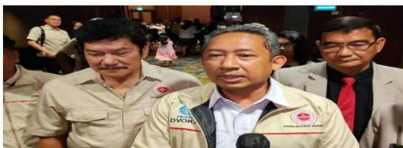
Wali Kota Bandung, Yana Mulyana.

Narasi ini memperkuat kesimpulan bahwa reformasi administrasi pendidikan Kota Bandung bukan hanya formalitas, melainkan usaha jangka panjang yang sudah dimulai sejak 2023 dan terus dievaluasi.