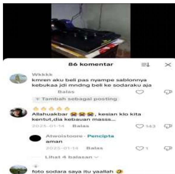
Gambar 3. Tanggapan Konsumen Terhadap Kualitas Produk

Perubahan perilaku konsumen menjadi hal yang penting untuk diperhatikan oleh pelaku usaha. Oleh karena itu, penerapan inovasi diperlukan agar bisnis mampu menyesuaikan diri dengan kebutuhan pasar. Namun, tingginya persaingan dalam industri konveksi serta kemudahan produksi belum sepenuhnya diimbangi dengan kualitas produk yang sesuai harapan konsumen. Pada kenyataannya, masih terdapat pelanggan yang merasa kurang puas terhadap produk yang diterima.