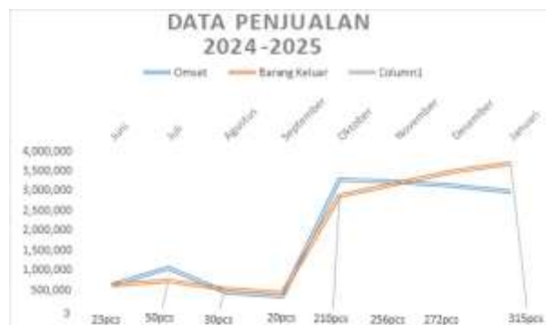
Gambar 4. Data penjualan konveksi sablon Atwoistoore

Konveksi Atwoistoore didirikan pada bulan Juni 2024 dan bergerak di bidang produksi kaos sablon, baik barang jadi maupun custom. Dalam beberapa bulan terakhir, permintaan dari pelanggan mengalami peningkatan, baik dari individu maupun kelompok. Hal ini menunjukkan bahwa minat pasar terhadap produk konveksi masih cukup tinggi, terutama di kalangan remaja, dengan banyaknya permintaan desain sesuai keinginan konsumen.