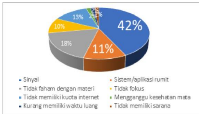
Diagram 2 Kendala yang dihadapi saat belajar secara daring