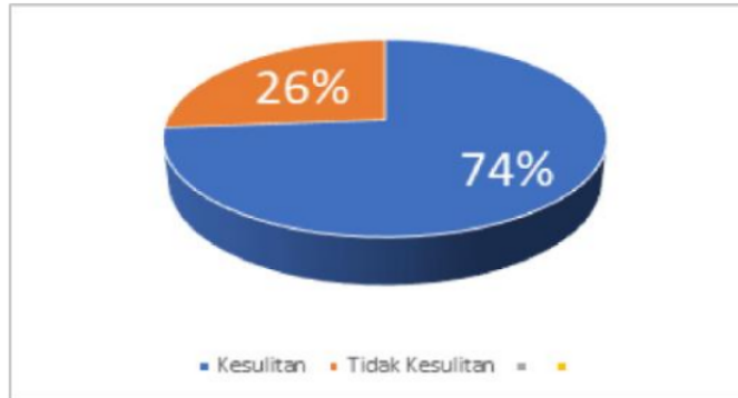
Diagram 1 persentase siswa yang kesulitan dengan belajar secara daring dan yang tidak kesulitan