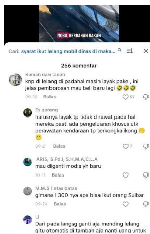
Gambar 2. Audiens yang aktif berkomentar

cetak dan online menjadi format video singkat yang sesuai dengan karakteristik pengguna TikTok. Interaksi yang tinggi dari audiens melalui komentar dan share memperlihatkan dinamika konvergensi budaya yang dijelaskan oleh Henry Jenkins, dimana audiens tidak hanya menjadi konsumen pasif, melainkan juga turut serta dalam proses sirkulasi dan diskusi informasi.