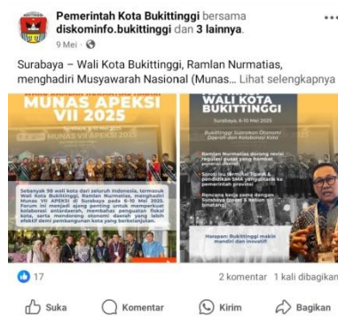
Gambar 4. Publikasi flyer kegiatan pimpinan di media sosial Facebook Pemerintah Kota Bukittinggi