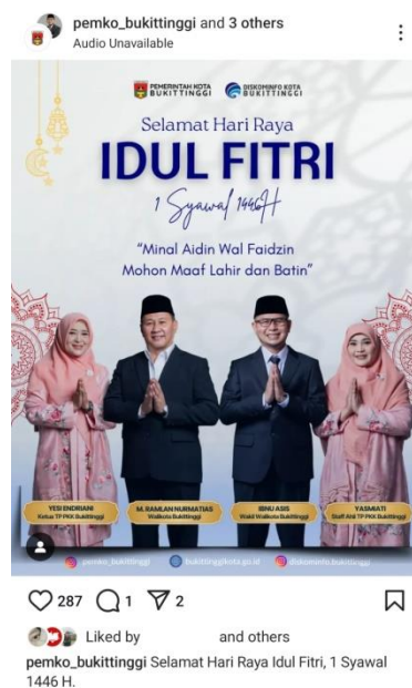
Gambar 5. Publikasi flyer hari peringatan di media sosial Instagram @pemko_bukittinggi

Terdapat sedikit perbedaan publikasi website dibandingkan dengan di media sosial dari segi narasi. Berita diunggah secara lengkap dan keseluruhan pada website. Sedangkan pada media sosial, narasi hanya berupa caption yang menjelaskan kegiatan tanpa adanya kalimat kutipan langsung dari pimpinan dalam kegiatan tersebut. Hal ini disebabkan kecepatan informasi yang dihadirkan pada media sosial tidak berbanding lurus dengan tingkat kualitas informasi atau pengetahuan (Zempi, 2023). Tidak hanya narasi, publikasi flyer dan video kegiatan juga harus diperhatikan. Visual yang menarik dan penyajian pesan yang mudah dipahami, menjadi hal yang harus dimiliki flyer dan video sebelum dipublikasikan. Publikasi yang menarik ini, berusaha diciptakan oleh bidang kerja IKP Diskominfo Bukittinggi melalui pemilihan foto, desain, warna, ukuran huruf, hingga musik latar dari setiap bahan publikasi kegiatan pemerintah (Gambar 6 dan 7).