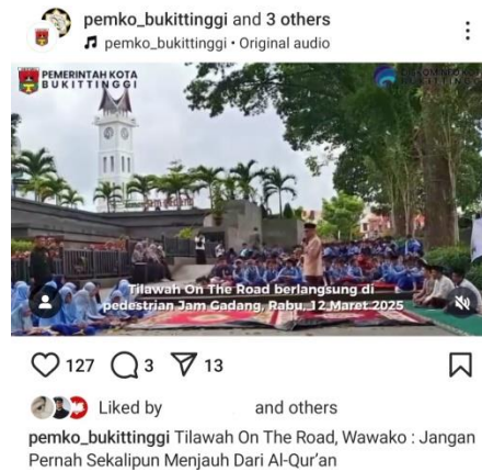
Gambar 6. Publikasi video kegiatan pimpinan di media sosial Instagram @pemko_bukittinggi