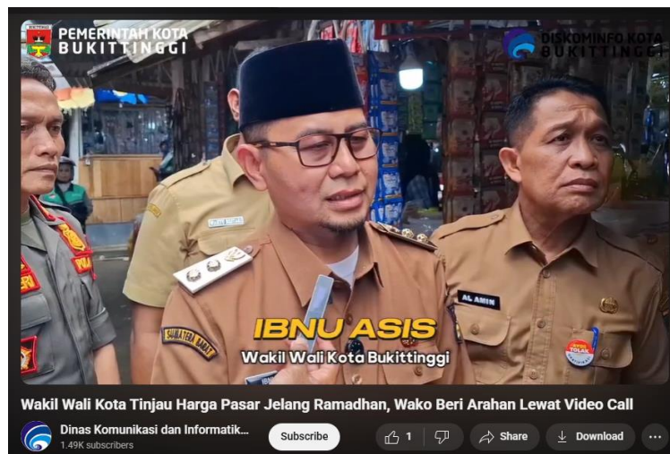
Gambar 7. Publikasi video kegiatan pimpinan pada aplikasi YouTube Diskominfo Kota Bukittinggi

Bidang kerja IKP Diskominfo Bukittinggi, melakukan publikasi kegiatan secepat mungkin, dan tidak memiliki waktu khusus dalam pengunggahan berita. Hal ini disebabkan karena, berita berkaitan dengan waktu, situasi dan kondisi terbaru dari pemerintah kota. Sehingga, kecepatan dan ketepatan waktu publikasi menjadi penting agar pemberitaan tidak basi dan selalu menjelaskan kondisi terkini pemerintah.