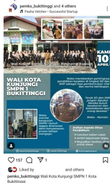
Gambar 3. Publikasi flyer kegiatan pimpinan di media sosial Instagram @pemko_bukittinggi

Publikasi adalah informasi yang dirancang untuk memperlihatkan, memperkenalkan, mempertahankan nama dan kehormatan seseorang, kelompok, atau suatu organisasi kepada khalayak dalam suatu konteks tertentu melalui media dengan tujuan untuk menciptakan daya tarik khalayak (Liliweri, 2011). Publikasi juga diartikan sebagai pelaksanaan dari kegiatan penyebaran informasi (Ridwan, 2020). Kegiatan publikasi menghasilkan citra dan citra juga sesuai dengan fakta-fakta yang telah dipelajari publik (Permini dan Atmaja, 2022). Sehingga, publikasi berita dapat diartikan sebagai upaya memperlihatkan sebuah data berupa fakta untuk menciptakan daya tarik khalayak. Bidang kerja IKP Diskominfo Bukittinggi, melakukan publikasi berita pada beberapa media, seperti media massa dan media sosial. Berita di posting secara resmi di Website Pemerintah Kota Bukittinggi, bersama foto dokumentasi kegiatan pemerintah. Sedangkan pada media sosial Instagram dan Facebook, berita dipublikasikan dengan flyer kegiatan yang dilengkapi dengan caption (Gambar 3 dan 4). Flyer di media sosial juga dipublikasikan dalam rangka peringatan hari tertentu, seperti Hari Raya Idul Fitri, Idul Adha, Kemerdekaan RI dan sebagainya (Gambar 5). Dokumentasi Video kegiatan, juga disebarluarkan kepada masyarakat melalui pengunggahan di fitur Reels Instagram serta aplikasi YouTube (Gambar 6 dan 7).