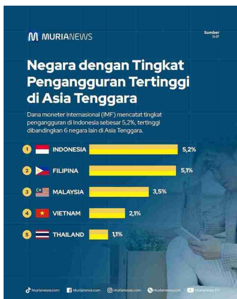
Gambar 5. Tingkat Pengangguran Tertinggi di Asia Tenggara oleh IMF

Implementasi (Peraturan Presiden (Perpres) Nomor 19 Tahun 2023 tentang Rencana Aksi Nasional Pencegahan dan Penanganan Tindak Pidana Perdagangan Orang Tahun 2020-2024, 2023) dalam tingkat nasional menunjukkan pencapaian yang cukup bagus. Capaian tersebut menunjukkan bahwa pemerintah serius dalam memerangi TPPO. Namun, tetap saja terdapat tantangan maupun hambatan dalam pelaksanaannya. Hal tersebut karena banyak faktor, salah satunya adalah lapangan pekerjaan yang kurang memadai dan angka pengangguran yang cukup tinggi. Tidak bisa dipungkiri, angka pengangguran yang cukup tinggi tersebut akhirnya membuat sebagian warga negara Indonesia memutuskan untuk mencari penghidupan yang lebih layak di negara lain, terkhususnya negara tetangga. Namun, yang mereka tidak tahu adalah banyak sekali modus TPPO yang mengatasnamakan agen penyedia lapangan pekerjaan. Modus tersebutlah yang kemudian yang membuat sebagian WNI terjebak dalam jebakan TPPO.