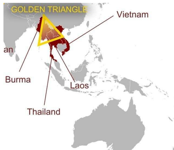
Gambar 2. Segitiga Emas Asia Tenggara oleh Daily Mail

Asia Tenggara merupakan sebuah kawasan yang terletak di benua Asia bagian tenggara. Asia Tenggara berada antara 29,1° LU - 11° LS dan 93° BT - 141° BT (Kusuma, 2022). Asia Tenggara terletak di antara benua Asia dan benua Australia. Selain itu, Asia Tenggara juga terletak di antara samudera Pasifik dan samudera Hindia. Posisi yang cukup strategis tersebut, membuat Asia Tenggara memiliki potensi keunggulan dalam hal perekonomian. Di lain sisi, posisi yang cukup strategis serta berada di kawasan tropis mendorong beberapa sindikat kejahatan bertumbuh di kawasan Asia Tenggara. Golden Triangle atau biasa disebut sebagai kawasan Segitiga Emas merupakan salah satu kawasan penghasil opium terbesar di dunia yang meliputi Thailand, Myanmar, dan Laos. Aktivitas perdagangan dan produksi opium di kawasan segitiga emas telah ditemukan sejak abad ke-19 dan masih berlanjut hingga sekarang (Syahirah, 2022). Adapun jenis narkotik selain opium dan obat-obatan terlarang yang banyak diproduksi adalah ganja dan ATS (amphetamine tipe stimulants). Wilayah Asia Tenggara yang sangat strategis menjadikan jalur perdagangan narkotik dan obat-obatan terlarang tersebut menjadi lancar. Selain narkoba, perdagangan manusia juga menjadi salah satu kejahatan yang tumbuh di kawasan Asia Tenggara.