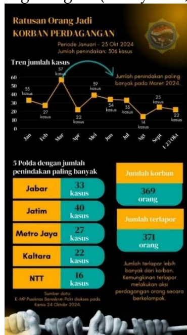
Gambar 1. Laporan Korban TPPO Periode Januari-Oktober 2024 oleh Pusiknas Bareskrim Polri

Isu keamanan dalam kajian hubungan internasional telah berkembang dengan pesat. Tidak lagi terbatas pada ancaman militer dari suatu negara, tetapi sindikat kejahatan internasional juga telah menjadi ancaman keamanan suatu negara (Nainggolan dkk., 2019). Lebih lanjut, sindikat kejahatan internasional ini biasa disebut dengan istilah transnational organized crime (TOC) (Yusro dkk., 2022). Menurut (Hartono & Bakharuddin, 2023) transnational organized crime , lebih dikenal sebagai kejahatan lintas negara yang terorganisir merupakan kejahatan lintas negara yang dilakukan oleh suatu kelompok yang terstruktur, dalam kurun waktu tertentu dan dilakukan secara terorganisir dengan tujuan untuk memperoleh keuntungan finansial atau tujuan tertentu. Salah satu bentuk TOC adalah Tindak Pidana Perdagangan Orang (TPPO). TPPO bisa disebut sebagai TOC karena TPPO melibatkan banyak pihak dari berbagai negara (Sandy dkk., 2023).