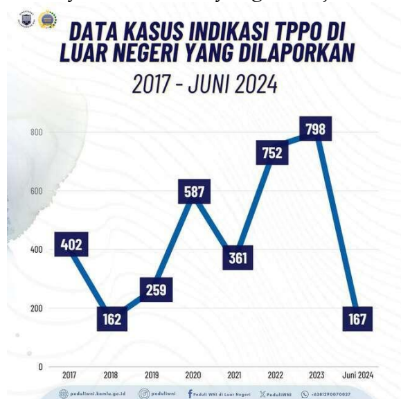
Gambar 4. Data Kasus Indikasi TPPO di Luar Negeri yang Dilaporkan oleh Kemlu RI

Salah satu bentuk diplomasi regional Indonesia dalam menangani TPPO adalah kerja sama Indonesia dengan Kamboja. Salah satu kerja sama Indonesia dengan Kamboja adalah melalui forum bilateral, Meeting on Immigration Matters . Forum tersebut dihadiri oleh Direktur Jenderal (Dirjen) Imigrasi Republik Indonesia dan Dirjen Imigrasi Kamboja yang membahas mengenai “Upaya Pencegahan Dan Penanggulangan Tindak Pidana Perdagangan Orang, Kejahatan Internasional Hingga Kerjasama Pengelolaan Perbatasan”. Dalam forum tersebut, terdapat delapan hal yang disepakati, yaitu pertukaran informasi imigrasi, pengaturan perpindahan orang secara legal dan tertib, penetapan status migran, memberantas penyelundupan dan perdagangan manusia, penanganan kasus pemalsuan dokumen perjalanan, pertukaran data statistik, pengembangan kelembagaan serta kebijakan manajemen imigrasi, pelatihan bantuan teknis dan peningkatan kapasitas (Valerisella dkk., 2025). Melalui upaya kerja sama tersebut, diharapkan dapat menurunkan angka kasus TPPO, khususnya untuk WNI yang bekerja di luar negeri.