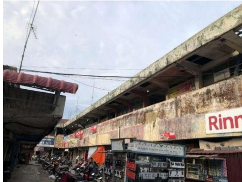
Gambar 1. Gedung Pasar Raya lama Yang masih belum di cat

Pada awal tahun 2024 terjadi kenaikan 25% terhadap retribusi yang menimbulkan polemik di kalangan pedagang. Kebijakan ini dilaksanakan untuk meningkatkan pendapatan daerah dan fasilitas pasar tetapi banyak pedagang merasa keberatan.