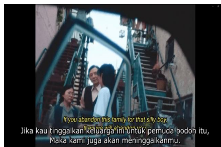
Gambar 1. Flashback Ayah Evelyn