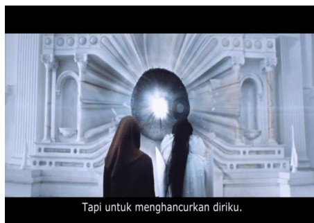
Gambar 9. Joy menjelaskan alasan membuat bagel

Jobu Tupaki menggugat konstruksi budaya Asia yang menuntut individu untuk memiliki “identitas utuh” dan “terdefinisi dengan baik”. Dalam masyarakat tekanan terhadap kestabilan identitas dan norma sosial merupakan bagian dari mitos budaya yang menekan individu untuk menyesuaikan diri secara total (Noh, 2018). Representasi Joy melalui pergantian kostum bukan hanya menggambarkan krisis identitas, tetapi juga menolak premis bahwa seseorang harus memilih identitas tunggal untuk bisa diakui.