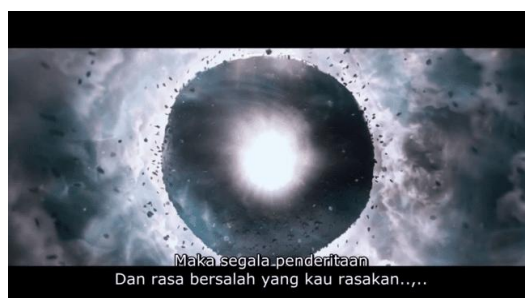
Gambar 6. Bagel hitam