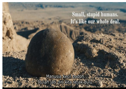
Gambar 7. Rockverse (Joy dan Evelyn dalam wujud batu)