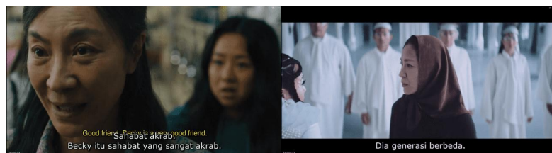
Gambar 5. Becky diperkenalkan sebagai teman akrab

Parenting yang otoriter dan terlalu menekan kerap dianggap sebagai bentuk cinta dan perlindungan oleh orang tua di Asia (Park, 2018). Jenis parenting tersebut dikonstruksikan pada film ini dengan sikap Evelyn yang dikatakan oleh ayahnya, bahwa Evelyn terlalu menekan Joy.