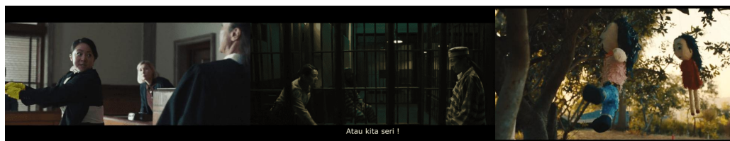
Gambar 10. Adegan - adegan Joy berganti identitas dan peran

Menurut Hall representasi adalah proses aktif pembentukan makna, bukan sekadar refleksi pasif atas realitas (Wright, 2016). Hal tersebut diwujudkan di film ini dengan bagel hitam yang bukan sekadar simbol keputusan, tetapi juga representasi dari sistem sosial yang tidak menyediakan ruang bagi identitas yang tidak pasti.