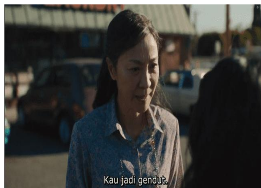
Gambar 3. Evelyn mengatakan sesuatu ke Joy

Gambar 2 kemudian merepresentasikan pantulan dari luka tersebut dalam generasi berikutnya melalui visual dan dialognya. Ketika Joy meneriakkan "Shut up!" dan Evelyn membalas melalui suaminya dengan "Jangan bicara ke ibumu seperti itu," kita menyaksikan bahwa Evelyn telah berpindah posisi: dari anak yang dikekang, menjadi ibu yang menuntut penghormatan dalam bentuk kepatuhan. Hal ini sesuai dengan konsep familial postmemory yang dikemukakan (Hirsch, 2013), yaitu saat trauma generasi sebelumnya ditransmisikan ke generasi berikutnya bukan sikap dan pola komunikasi. Kedua adegan saling terhubung: trauma pengabaian dan tekanan generasi sebelumnya yang diwariskan dalam bentuk kontrol emosional dan represi ekspresi diri.