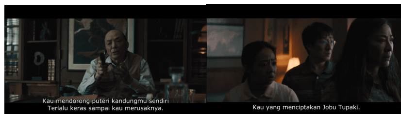
Gambar 4. Ayah Evelyn

Contoh dari trauma antargenerasi direpresentasikan dalam pola komunikasi yang tidak sehat pada adegan ini. Evelyn dibesarkan dalam masyarakat yang mengutamakan penampilan dan kepatuhan, jadi dia tidak pernah diajari cara menunjukkan cinta secara langsung. "Kamu makin gemuk," adalah cara Evelyn mengungkapkan kekhawatiran berdasarkan pola cinta yang diwariskan, bukan sekadar kritik. Postmemory dapat ditemukan dalam ucapan dan sikap yang diwariskan, bukan dalam cerita itu sendiri (Hirsch, 2008). Dalam keluarga Asia, emosi sering dikomunikasikan secara terselubung dan berpotensi menyakitkan, karena disaring melalui generasi yang mengalami represi dan luka historis (Chou et al., 2023). Meskipun trauma dan rasa tidak aman mendorong Evelyn untuk memilih "topik aman" yang pada akhirnya menyakitkan, dia tetap ingin melakukan percakapan dari hati ke hati. Adegan ini menyiratkan bahwa dia belum pulih dari luka yang diwariskannya. Secara representasional, ucapan Evelyn juga memperlihatkan bagaimana identitas dalam film ini dibentuk dan ditekan oleh struktur budaya dan trauma.