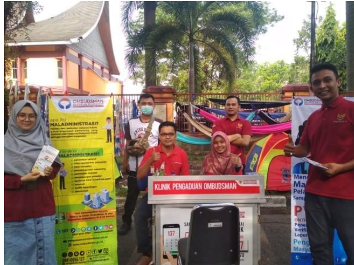
Gambar 1. Kegiatan Penerimaan Verifikasi Laporan On The Spot