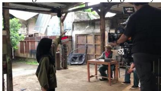
Gambar 2. belajar menjadi Clapper

Proses ini menjadi dasar bagi editor dalam mengorganisasi footage .