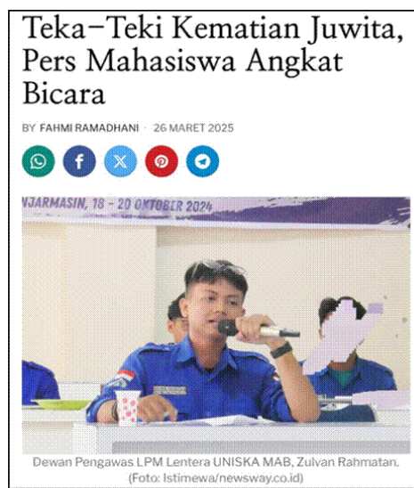
Gambar 7. Potongan Pertama Pemberitaan yang Tidak Memenuhi Indikator Non Sensasional

Berikut ini merupakan contoh pemberitaan yang mengandung unsur sensasional dengan judul “Teka-Teki Kematian Juwita, Pers Mahasiswa Angkat Bicara” yang dipublikasikan pada 26 Maret 2025.