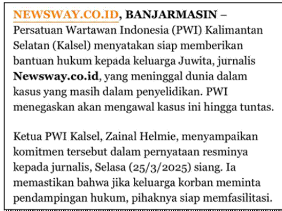
Gambar 7. Potongan Pertama Pemberitaan yang Memenuhi Indikator Non Sensasional

Selanjutnya, terdapat contoh pemberitaan yang memenuhi indikator non sensasional, yaitu “PWI Kalsel Apresiasi Langkah Cepat Polisi dan Lanal Balikpapan dalam Mengusut Kasus Juwita” yang dipublikasikan pada 26 Maret 2025.