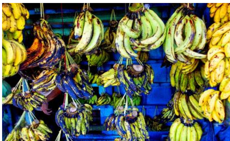
Gambar 1. Berbagai Jenis Pisang yang Dijual di Pasar Kordon

Secara fisik, Pasar Kordon tampak sebagai satu kesatuan kawasan pasar, namun dalam praktik pengelolaannya terbagi ke dalam beberapa otoritas. Area yang menjadi fokus penelitian berada pada lahan seluas kurang lebih 1.040 m 2 dan berada di bawah satu koordinasi pengelolaan, yang dipimpin oleh Bapak Sulis. Di area ini terdapat sekitar 190 pedagang aktif, yang terdiri atas pedagang yang menempati lahan milik pribadi serta pedagang yang berada di atas lahan milik PT KAI. Keberagaman jenis usaha yang dijalankan, mulai dari penjualan makanan dan minuman, sembako, hasil bumi, hingga kebutuhan rumah tangga, mencerminkan karakter pasar tradisional yang melayani kebutuhan dasar masyarakat sehari-hari. Penelitian ini secara khusus memusatkan perhatian pada area pasar yang berada dalam satu pengelolaan tersebut, karena memiliki struktur organisasi, karakter pedagang, serta pola aktivitas ekonomi yang relatif seragam, sehingga dinilai relevan dan representatif untuk dianalisis lebih mendalam.