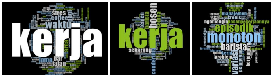
Gambar 1. Word Cloud Kata Kunci Penyebab Boreout

Analisis tematik mengidentifikasi tiga dimensi utama penyebab boreout pada konteks ini: